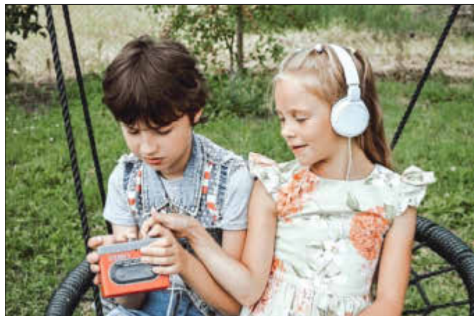
So sehen junge Hörspielautoren aus

Anmeldungen werden auf der Homepage unter www.kunsthau-neustrelitz.de , per E-Mail an kunstschule@kunsthau-neustrelitz.de oder telefonisch unter 03981 256040 entgegen genommen.