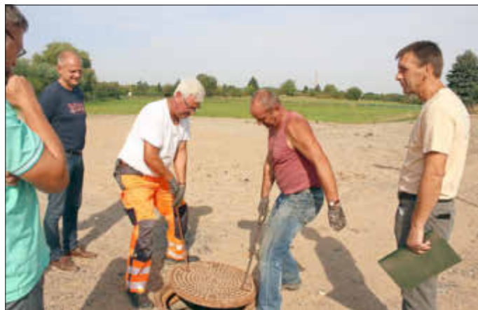
Genauere Kontrollen bei der Bauabnahme