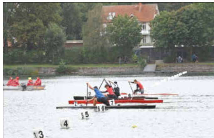
Start zum Canadierrennen

Medaillen bekommen haben die Gewinner natürlich trotzdem, auch wenn es statt vor Publikum nur im Kreise ihrer Vereine war. Sollte es nicht zu einem der drei ersten Plätze gereicht haben, kann sich jeder