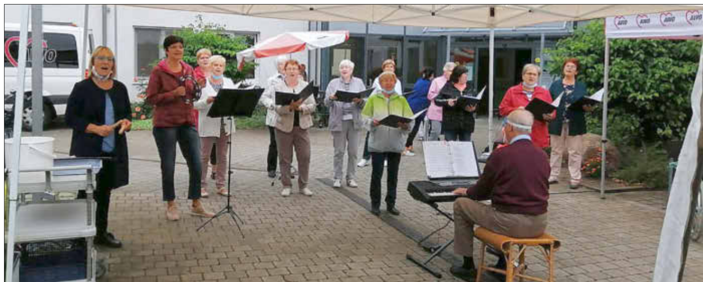
Der Frauenchor Freundschaft erfreut mit seinem Programm

Jahr das Bingo-Spiel nicht fehlen. Bei diesem Klassiker unter der Moderation von Herrn Popke gab es für alle kleine Präsente. Alle Beteiligten blicken auf einen wunderschönen Nachmittag zurück und danken allen herzlich, die zum Gelingen beigetragen haben. (PM/AWO)